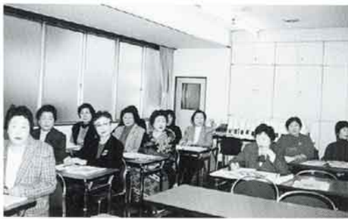
女性部会研修風景

冷水統括からは、「税務署では確定申告書の自書申告を推進しており、国税庁のホームページもぜひ役立ててほしい」との挨拶であった。