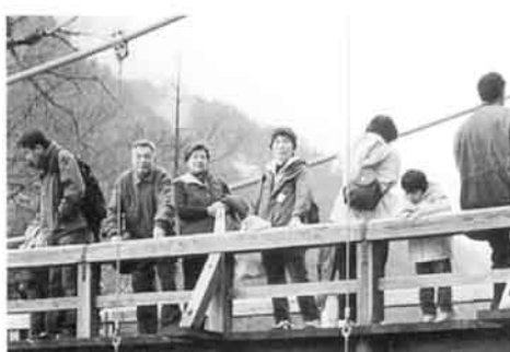
上高地河童橋にて