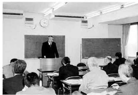
自分で土地の評価額を計算中

贈与税については、平成15年度改正の(研修開催時は国会審議中)相続時精算課税制度について触れられ、選択の仕方によっては、納税額に差が出てくるとのこと。