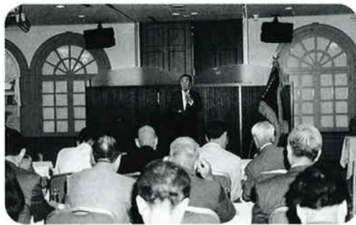
熱気溢れる支部長会

東副署長はじめ署の幹部の方々、税理士会江東東支部宗川副支部長、大同生命保険幹部のご出席