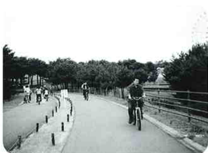
気持ち良い潮風の中 サイクリング

コースは国営ひたち海浜公園(潮風が気持ち良い花と緑の遊園地……広大な園内には、樹木・スポーツ・草原・海浜・カルチャー・プレジャー等、6つのゾーンがあり、砂丘ゾーンだけでも、東京ドームの1・8個分)―那珂湊(具沢山の海鮮井とズワイガニの昼食・魚市場での買物……新鮮で豊富な魚介類が驚くほど安い)―千代田村のぶどう農園