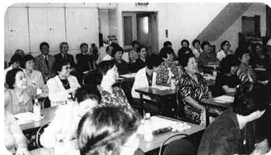
一同勇気と感動を共有

孤独と責任感に押し潰され回りの見えない状態で、人の声も入らない意固地な性格だったと反省されていた。