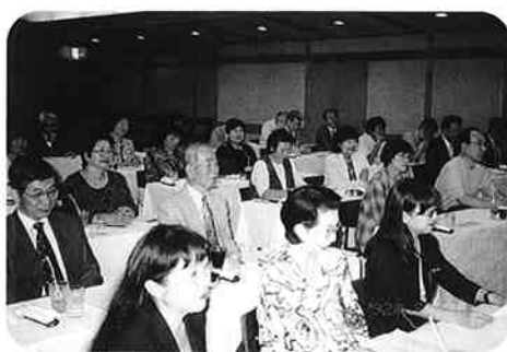
難しいテーマでも判りやすく研修

③後継者が、若年で大金を手にしたばかりに人生を誤る例も多い。僅かな金を贈与し続けていき、企業経営のあり方を学ばせた方がよい。」と総括された。