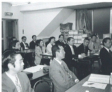
真剣に聞き入る青年部の皆さん

などから時代の流れを読み取ることに心がけてきたという、常に情報と向き合う姿勢を話していただいた。