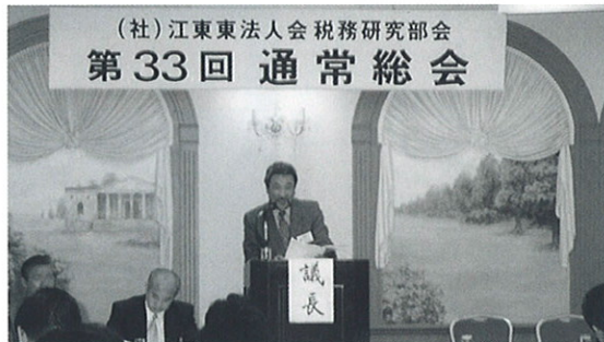
(社)江東東法人会 税務研究部会 第33回 通常総会

第2部の総会は、部会長の挨拶の後、平成15年度事業報告、収支報告、平成16年度事業計画(案)、収支予算(案)について審議され、全て承認可決され、終了した。