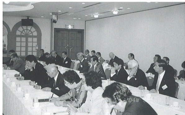
明解な解説に聴き入る

代に限り、国から借りる。) 庄園制(奈良・平安時代。新たに農地開墾したら、土地は私有できる。) 太閤検地(安土桃山から江戸時代まで。土地の面積だけでなく、質によつて穀高を決める。)と変わつても、この間は年貢(現物)で納めていた時代。(3) 地租改正(明治6年。出来高でなく、土地の価値の3%を課税)で、貨幣で納める時代になった。(4) 戦火が続いたので近代は、戦費と税制が密接な関係。(1) 利子取得に源泉所得税を導入(日清戦争) (2) 所得税の増税(日露戦争) (3) 物品税・入場税等の創設(昭和13年) (4) 勤労所得に源泉徴収(昭和15年) (5) 戦後、現在の税制が整う。① シャンプ税制(昭和24年。直