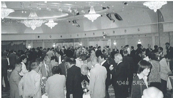
真剣に語り合う会員の皆さん

懇談会は東副署長の乾杯で歓談の輪が広がり、異業種間の情報交流の場となり、厳しい経済環境の中にも熱気が会場内を包んだ。