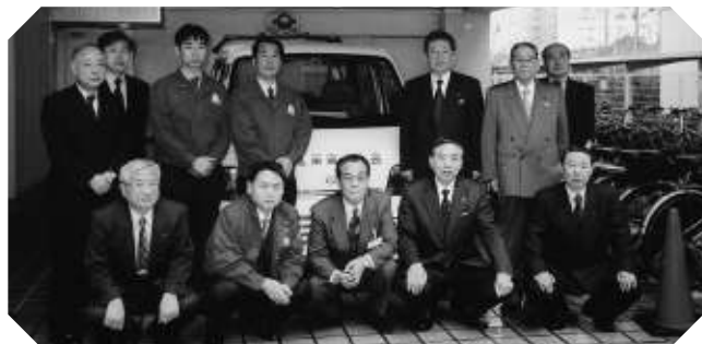
出発前に署の方々と