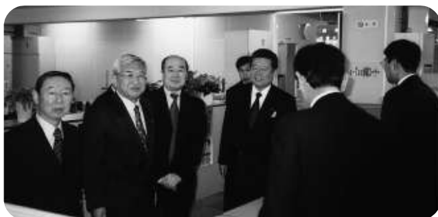
役員も早期提出に協力