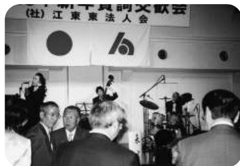
バンド演奏で和やかに懇談

従って外国人投資家は、今年9月の自民党の総裁選挙において、次期総裁になる人が小泉構造改革を進展させる人であればポジティブに、停滞もしくは後退させる人であれば、ネガティブに反応するだろうと結んだ。