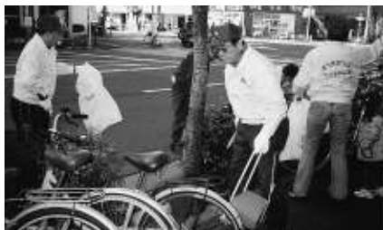
放置自転車、じゃまですよ。

第17回『まちをきれいに』が1月29日(日)午前9時30分から砂町地区で行われた。110余名の参加者は、清洲橋通り、明治通り、丸八通りを清掃し、45㍻袋のゴミを収集した。