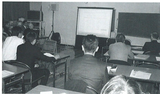
実際に手順を研修

はじめに、(1)平成 18 年分所得税法の改正事項として、①寄付金控除の改正(適用下限額が 5 千円に) ②確定申告を要しない配当所得(非上場株式等では、年 1 回配当なら 10 万円以下)等の解説があり早速、本題に入る。