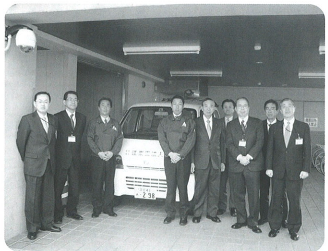
出発前に署の方々と