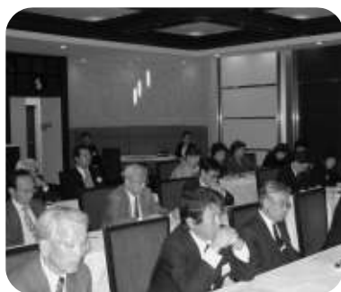
講演に聴き入る部会員

総会後の懇談会は税務研究部会らしく、いつものように和やかな意見交換の場となった。