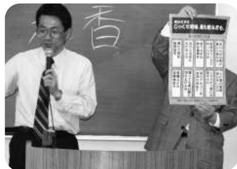
「適正飲酒の心得」とは

(3) 《製造法》①吟醸酒とは吟醸造り(特有の芳香である吟香をもつ)に由来。②本醸造酒とは(精米歩合70%以下の白米、米麴、醸造用アルコール、水が原料で)香味、光沢の良好なもの③原酒と生一本(二つの醸造所で作られたもののみで出来ているもの)の違い(4)《その他》①飲み頃で壺詰にしているのが早めに飲む事(日光臭や老香は25度以上で進む)②飲んで30分から1時間で血液中のアルコール濃度が最高になる。この酔いのピークを小さくすると悪酔いしない。駆け付け3杯や一気飲みは良くない。③肝臓がアルコールを分解し、脂肪を合成するのだが、貯まると脂肪肝になり、これがアルコール性肝炎になる。(強いアルコールは薄めて飲むとよい)④等、再認識させられる内容であった。