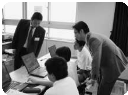
増税する? 公債にする?

パソコンを使った街づくりゲームでは「南側に住宅地、東側には公共施設、駅前には商店街」と実際の市長さながらに街づくりを行ったクラスマートの発表に教室が沸く。