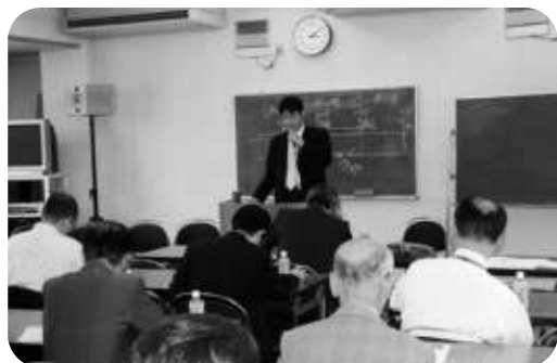
身近なテーマに傾聴

①減価償却制度①《平成19年4月1日以後に取得する資産》では、残存価額及び償却可能限度額(95%)を廃止し、1円(備忘価額)まで償却できる。