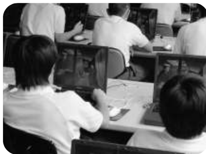
アナザーワールドへようこそ

「日本の税金は本当に高いの?」署の講師により、世界の先進各国との税金の国民負担率の比較:日本の負担率が決して高くない結果にもクールな表情の生徒たち。まだまだ「税金」は遠い存在なのかもしれない。続いて『アナザーワールドへようこそ』を観る。税金が無くなった世の中を描いた『あり得ない』世界に生徒たちの間から笑いも起るが、税金の持つ役割についてそれぞれ何かを感じ取ってくれている様子だ。