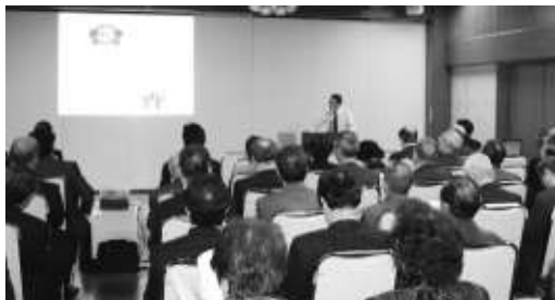
パワーポイントで判りやすい説明

脱税についての情報収集は新聞、週刊誌、投書、通報によるところが多く、特に投書、通報は愛人、リストラされた社員から多く寄せられる。