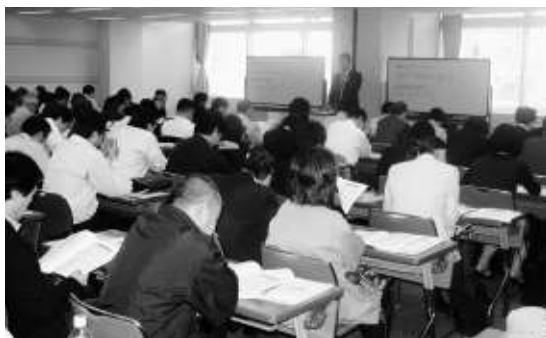
会場一杯の参加者

移譲に伴う)③損害保険料控除が改組され、地震保険料控除が設けられる。：等々である。全会員を対象とした税法説明会はこの他に、支部研修会(改正税法に限らず、誤りやすい身近なテーマで研修)・年末調整説明会(年に一回の事なので忘れてしまう事項も多く、いつも多数の会員が参加。源泉徴収に関連する改正の説明も受けられる。)、決算