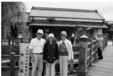
佐原の街並をバックに

水産(シヨッピング)―フルツ(巨峰)狩り。今回は、言わばグルメツアーの内容であったのだが、佐原では思いがけなく、伊能忠敬の旧宅の見学もあり、楽しい一日を過ごした。