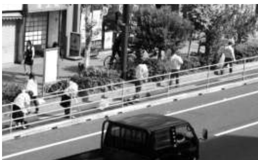
京葉道路に沿って清掃