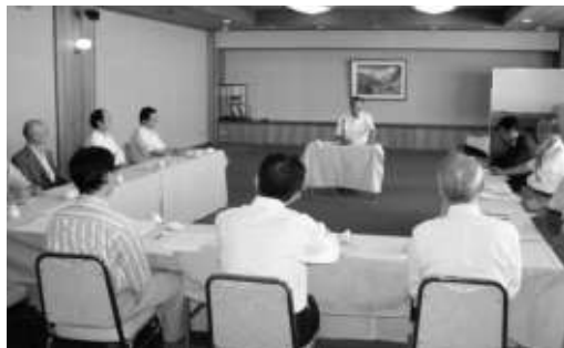
事例を交えての判りやすい研修

の受給に関する申告書を会社に提出しないと、20%課税、(2)非居住者(日本に住んでいない者)に対する支払い①原則は20%課税。例えば、海外