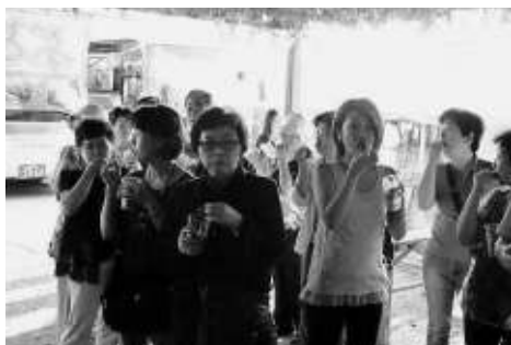
巨峰の試食 お味の方は？