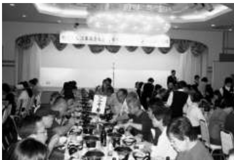
豪華な昼食に舌鼓み