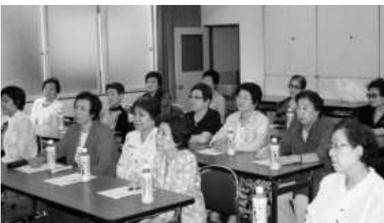
判りやすく楽しい説明に興味津々

江戸川、関東平野の三角洲に位置し、土地が肥沃で気候温暖。「千葉の女が乳搾り」という言葉は、男が汗水たらして働かなくても物が育ってしまう為、女手でも生活が出来る。楽しく食っていくこうとする輩