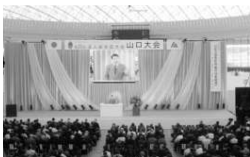
2,200人の参加で会場がギッシリ

同委員長は、「①法人税基本税率の引き下げ ②国際競争力強化や国内産業の空洞化防止さらには外国資本の国内への投資促進の観点から、地方税を含めて、欧州・アジア主要国並みの実効税率とするよう求める③中小企業軽減税率の引き下げ ④軽減税率を22%から20%程度へ引き下げ、適用課税所得金額を1千5百万円