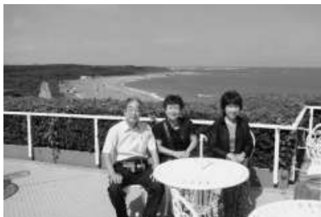
犬吠埼ホテルのテラスにて