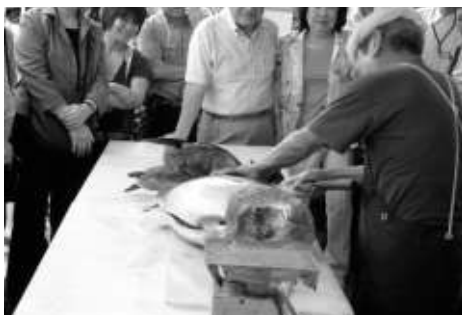
豪快なマグロの解体ショー