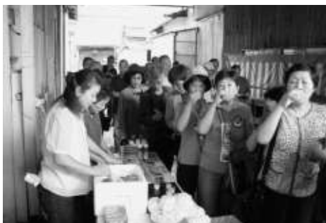
東薫酒造で利き酒