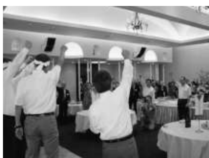
目標数達成に向けてガンバロー！

長が「日頃から役員会で会員増強の意義や重要性について説明して、理解していただいている。昨年度は同業者や飲食店を重点的に役員が勧奨を行い、良い結果が出せた」と報告された。