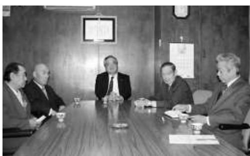
和やかに意見交換