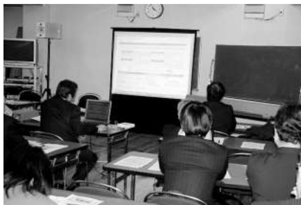
e-Tax による 法定調書作成の研修