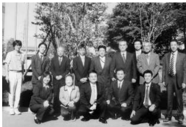
キャノン取手工場にて（企業研修）

昭和 46 年に発足した青年部会は、税務当局や法人会幹部の皆様の深いご理解とご協力の元、伸び伸びとした活動をさせて頂いております。