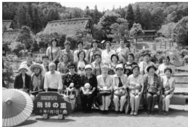
飛騨高山にて（一泊研修会）

全国で最初に創部し、『和やかに』をモットーに、 つつが 恙無く受け継がれ 42 年たちました。