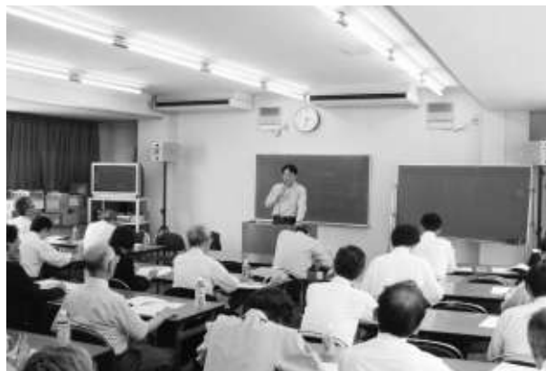
ユニークな税の知識を クイズ形式で研修

百年に一度といわれる世界同時不況の中、厳しい経営環境に企業は存続のため苦闘しております。