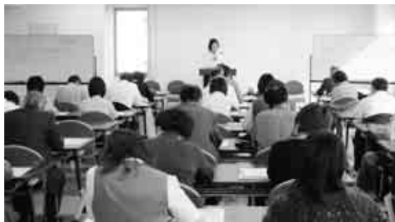
会場一杯の参加者

度が平成21年 及び平成22年 中に取得した 土地等の譲渡 所得について は1000万 円の特別控除 (所有5年超 が条件) 税法説明会 はこの他に、 支部研修会・