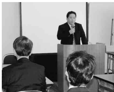
講師 前田法1 上席

滞納する人 はごく一部で あり、ほとん どの納税者が 期限を守って いる。そのた め徴収職員は 滞納者に対し、 基本的に差押