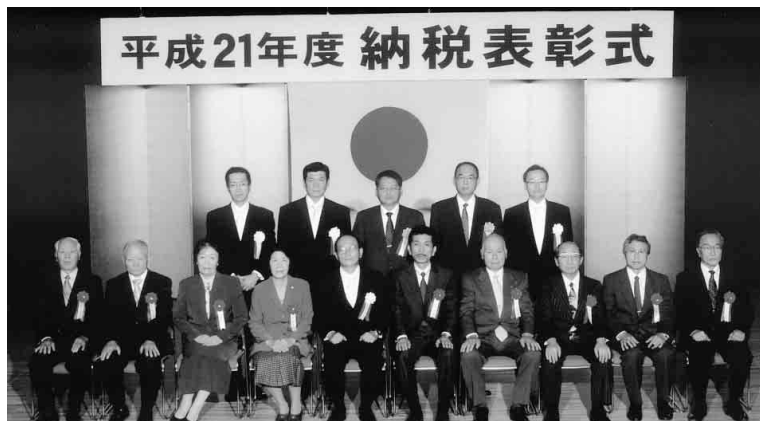
署長感謝状を受彰された皆様

原江東東税務署長と佐野江東東税務親和会会長の2氏が式辞を述べた。引き続き、中学生の税についての作文の表彰状の贈呈が行われ、贈呈後、受彰者のう