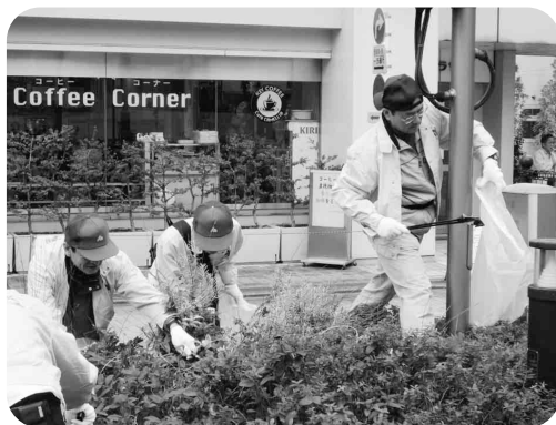
江東東税務署職員も汗を流しました