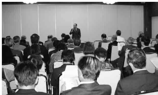
熱心に聴き入る参加者