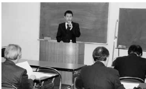
身近なテーマを丁寧に解説