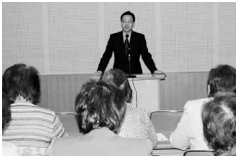
税務行政の変遷を説明

消費税が施行。 消費税が施行。 (2)平成6年〜7年：①バブル崩壊後の景気刺激策として「20%定率減税」が行われた。②阪神淡路大震災の被災者の負担を軽減するため、「震災特例法」が施行。(3)平成13年：①「中央省庁再編」が行われた。②「情報公開法」が施行され、国税庁においても通達の見直しが行われた。