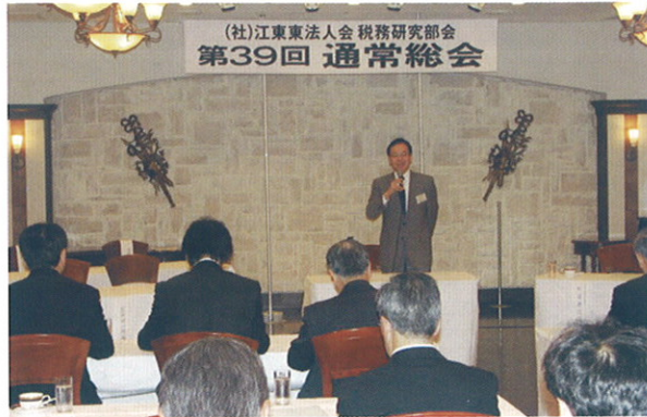
会場一杯の参加者

最近では納税者サービスに力を入れている。国税庁ホームページにおける情報提供や租税教育、各種説明会の開催等、納税者が自発的に申告を行うための環境整備がこれに当たる。後半は通達についてお話をいただいた。