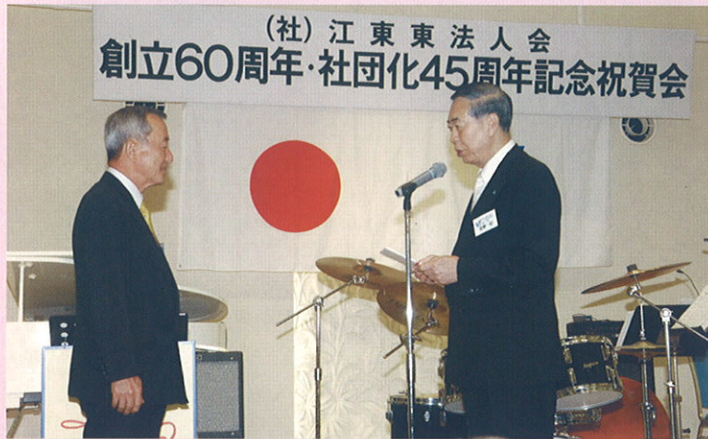
江東区に対する記念品贈呈