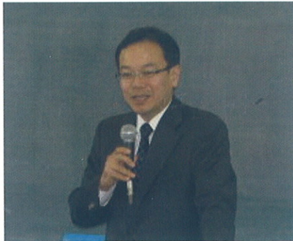
源泉所得税調査を解説

1. 源泉所得税の源泉所得税担当の仕事 (1) 納付事積の整理 (2) 未納整理 ・ 納付の確認で きない源泉徴収 義務者へ、源泉 所得税事務集中処理センターから照会ハガキを送付し、回答の状況によつて電話や訪問も行う。 (3) 源泉所得税の調査 ・ 納税額が正しいか確認。 2. 国際化と源泉所得税 ・ 近年、国際取引に係る源泉所得税の調査を中心に行つた。