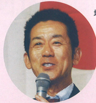
地元だから ちから「力」が入ります