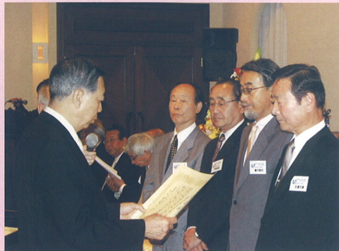
会員増強運動に功勞