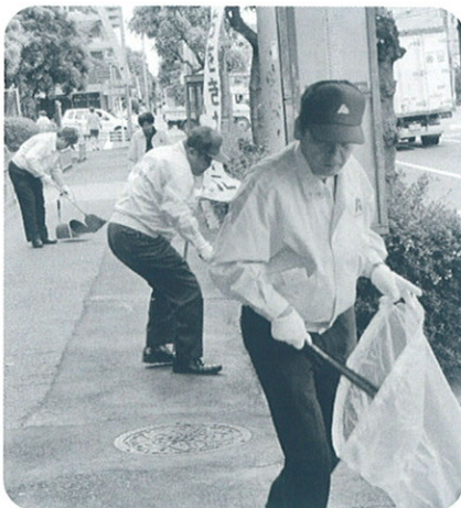
良いチームワーク