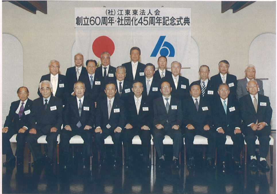
受彰者で記念撮影