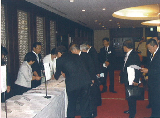
受付はこちらです