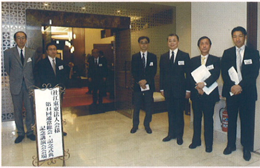
いらっしゃいませ