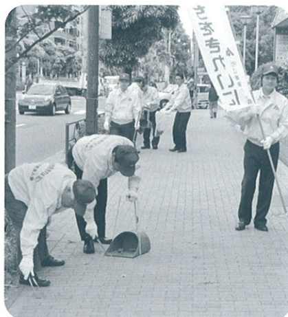
キャンペーンしながら清掃

砂町地区で 5 月 29 日(土)、総勢 96 名が参加して行われた。午前 9 時 30 分に南砂 5 丁目の松本寝具(株)本社に集合し、早速清掃活動に入った。明治通り～葛西橋通り～清洲橋通り～丸八通りを清掃し、45 リットルのゴミ袋で 25 袋分のゴミを収集、午前 11 時 30 分に終了した。