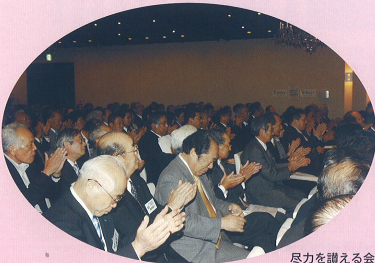
尽力を讃える会場