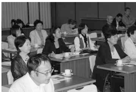
講演に聞き入る参加者

れて相乗効果となっている。長引く景気低迷により、老舗といわれる企業にも厳しい経営活動を強いられるところも多くなるが、逆に創業8百年、5百年といった老舗のなかには隆々としているところもある。特に京都にそのようなところが多い。