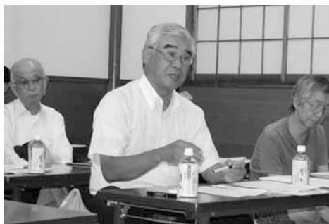
自身の経験事例を質問する会員