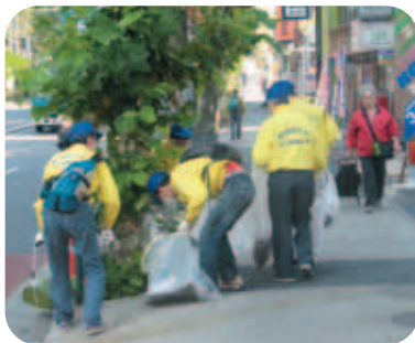
誰れが捨てるのか植込みのゴミ