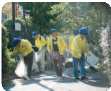
皆さん頑張ってます

橋通り、明治通りを清掃し、 45リットルのゴミ袋で18袋の ゴミを収集し、午前11時30分 に終了した。