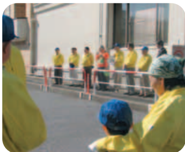
実施にあたってのごあいさつ