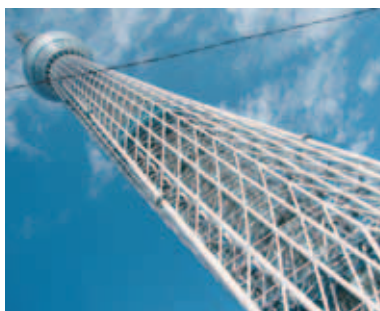
眼前にそびえ建つスカイツリー