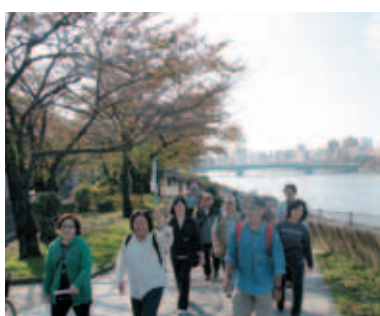
隅田公園を歩いてゴールへ