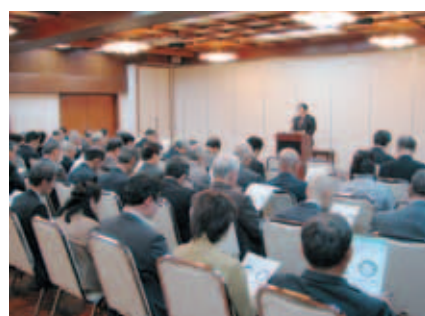
音署長の講演に70名が参加

り、最も多い税目は法人税である。また、実刑判決を受けた人は、平成22年で6人、1人あたりの懲役月数は13・8ヶ月、罰金は1人あたり2千万円にのぼる。最後に音署長は、脱税は割の合わない所業であり、適正な申告・納税をすることが肝心であると講演を結んだ。