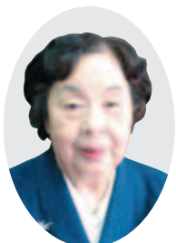
宮崎前女性部会長