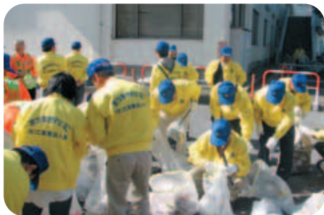
収集したゴミを分別