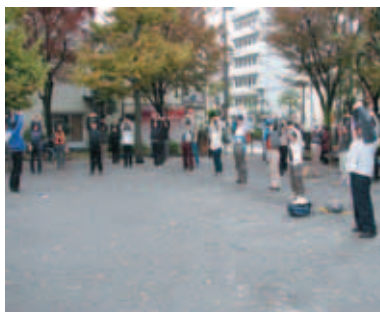
スタート前のストレッチ