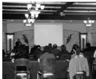
映像を使つての講演