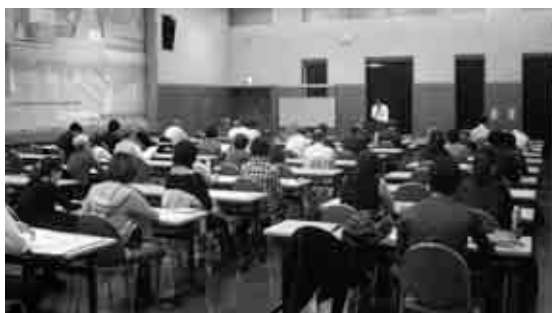
砂町地区での説明会