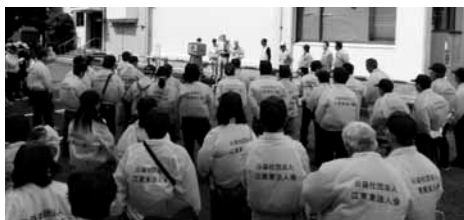
たくさんの方々が参加

五月晴れの中、5月18日(土)大島地区において、31回目となる当会の社会貢献活動「まちをきれいに」が、実施された。