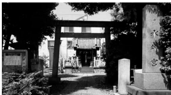
現在の亀戸水神宮

この神は「ミスハノメ神」であつて、古書記には「弥津波能売神」と書き、日本書紀では「凶象女神」と書かれていて、伊弉那岐・伊弉那美二神の御子神で、畏くも天照大神の御姉神に当らせられる。父母の神は、我が大八洲国を造り給うた国土経営の神で