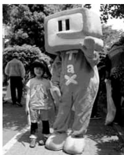
イータ君も活動をPR

参加者は、西大島の交差点を中心に、明治通り、新大橋通り、緑道公園を清掃し、45リットルのゴミ袋で約20袋のゴミを収集し、午前11時30分に終了した。