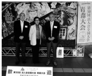
当会からの参加者

ら重要だが、国民に痛みを求めることには変わりない。また、行政改革の徹底は消費税引き上げの前提となっている。「まず隗より始めよ」の精神に基づき地方を含めた政府、議会が自ら身を削るのは当然である。