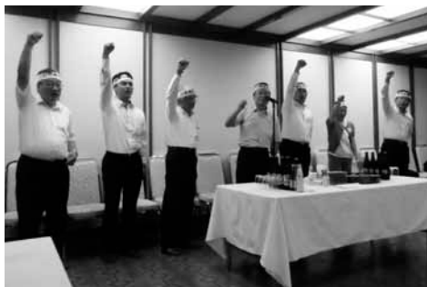
目標達成祈願シュプレヒコール

会員増強月間は9月～12月までとし、増強目標数は73社とする。その達成のための具体的な施策として、①9月中に各支部において役員会を開催して、未加入法人への加入勧奨の行動計画等の立案②本・支部役員各1人が1社の加入勧奨の励行③委員会委員、部会役員は、所属支部の加入勧奨への応援④他支部の未加入法人のうち、知り合いの経営者がいた場合の支部を超えての加入勧奨の励行などを説