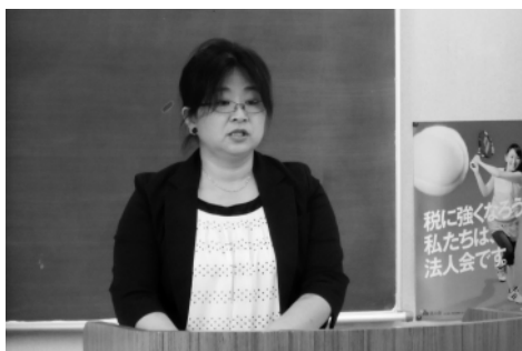
わかりやすく説明する松尾上席

研修会では、賞与に対する源泉徴収額の算出方法と、年中途で非居住者となった者が後発的事由により帰国し居住者となった場合の年末調整、給与の計算期間の途中で非居住者となった者に支給する超過勤務手当、契約期間が2ヶ月以内の者に支払われる給与等で日額表の内欄の適用の計算方法などについて次のとおり説明された。