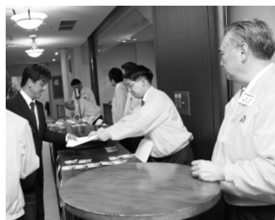
当会青年部会員が総出で受付

飾、江戸川北、江戸川南、江東西、江東東の11単位会で構成されている。1年間の任期交代制で担当会が選出され、そこからブロック長が選任された。