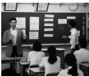
税の集め方ゲームの趣旨を説明する青年部会員

わが会の租税教室は一方的な講義形式よりも、生徒たちに自ら考え、発言してもらうことを旨としている。