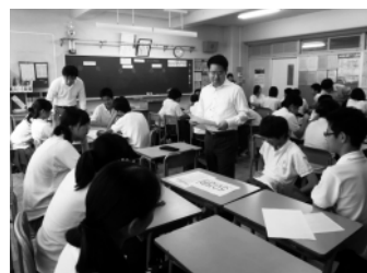
生徒たちの議論にアドバイスをする青年部会員

飾、江戸川北、江戸川南、江東西、江東東の11単位会で構成されている。1年間の任期交代制で担当会が選出され、そこからブロック長が選任された。