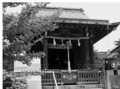
現在の富士浅間神社

そのとき渡り神の荒れる心をなだめるべく同行の愛妃、弟橘姫は海上に敷物を幾重にも重ね、その上に身を投げ海神の生き贄となり海難を救い