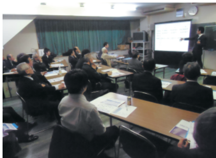
パワーポイントで詳しく説明

Ⅱパートタイム労働者・有期契約労働者から正社員に転換する試験制度を設け実際に転換または派遣労働者の直接雇用を行った事業主 金額Ⅰ①有期契約労働者↓正規雇用 一人当たり50万円(母子・父子家庭の場合60万円)②有期契約労働者↓無期雇用 1人当たり20万円(母子・父子家庭の場合25万円)③無期雇用労働者 1人当たり30万円(母子・父子家庭の場合35万円) 窓口Ⅱ都道府県労働局また