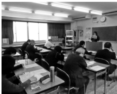
資料をもとに説明を受ける参加者

源泉部会では、昨年度から源泉所得税の基本を学ぼうを研修の基本コンセプトとして、ほぼ隔月で研修会を実施している。