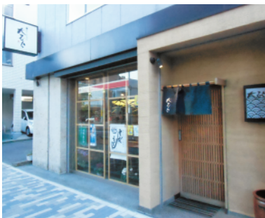
モダンでお洒落な入口

る。2Fは最大30名まで入れるテーブル席があり、1Fが木の温もりが感じられる雰囲気に対して、2Fは白と黒の落ち着いた空間になっている。