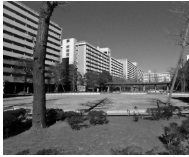
マンモス・大島六丁目団地

あり、ホームは川の上にあつて、東西の改札口は江東、江戸川両区にある珍しい駅である。地下鉄はここから荒川放水路をわたり船堀駅に達し、一之江、篠崎駅(61年9月13日開通予定)を経て、国鉄総武線本八幡と京成八幡に接続する予定で工事が進んでいる。駅の近くに第三大島小学校、第五大島小学校がある。