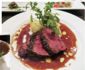
アンガスビーフ赤ワインソース