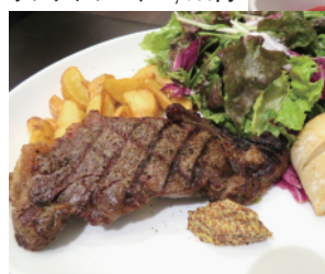
カラメルアップルとブルーチーズバーガー 1,200円