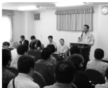
松本会長の挨拶でスタート

5月20日(土)砂町地区において、38回目となる当会の社会貢献活動『まちをきれいに』が好天に恵まれ実施された。