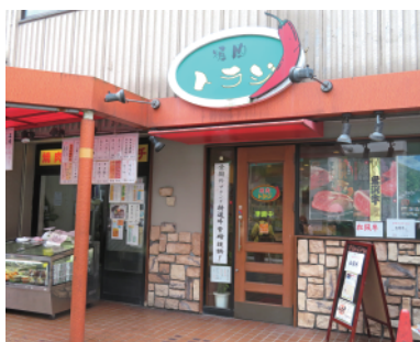
入口横に販売コーナーがある