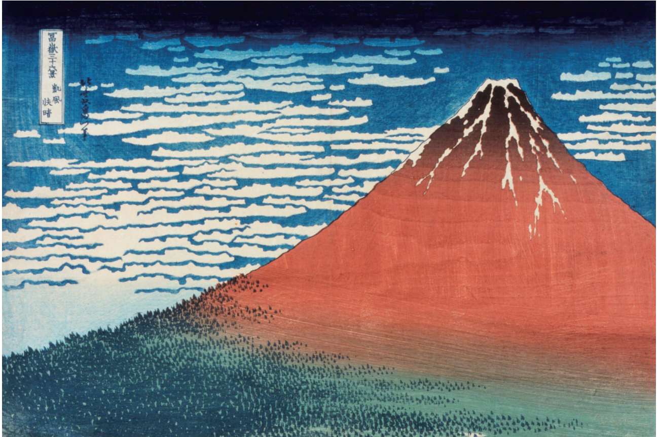
すみだ北斎美術館蔵