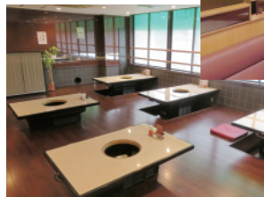
宴会にピッタリの2階