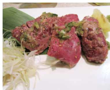
オーナーお勧め究極ハラミステーキ ¥2,500