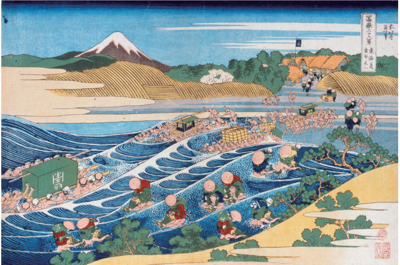
すみだ北斎美術館蔵