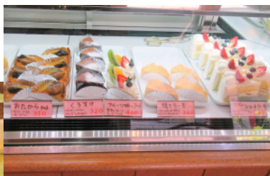
ぜんぶおススメ 320円〜500円