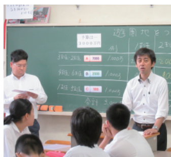
税金集めゲームを進行する部会員

公平に税金を集めるのかを各班で議論した結果、③班から①班は収入が多いから全額負担(垂直的公平)をすべきと意見が出ると、①班からはどの班も等しく3割負担すればよいではないかと反論(水平的公平)。又、②班からは①班の負担は2300万円、②班は600万円、③班は100万円の負担(応能負担)はどうかと両案の良いところを取り入れた折衷案も出た。