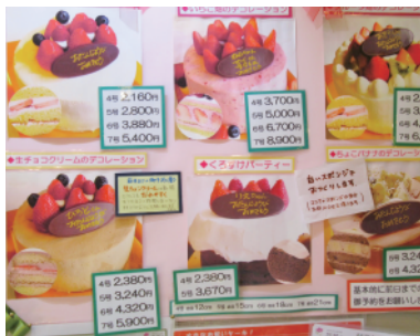
ホールケーキのご予約は前日までに！

贈り物に重宝な焼き菓子は、可愛いポーチや巾着に入ったものや、リボンでラッピングしてくれる箱詰めもある。その他、予約制のホールケーキも「可愛い！」と大人気で、動物クッキーとフルーツで飾られた『動物の森デコレーション』や『くろすけ』にたっぷりの生クリームとフルーツを乗せた『くろすけパーティー』など7種類ほどあり、