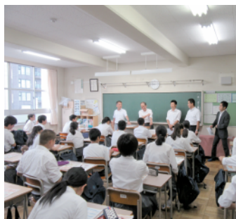
真剣に聞き入る生徒

税金を集めるうえでのキーワードは「公平」で、消費税など皆が同率で税を負担する「水平的公平」、所得税などのように多く稼いでいる人が多くの税を負担する「垂直的公平」などについて、税理士先