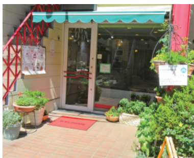
「花笑み」さんの入口