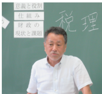
税理士会 島村支部長

3年生を対象に3クラス一斉に開始。始めに東京税理士会江東東支部の税理士先生が、まず、「税金の意義と役割」、次に「税金の仕組み」について説明をされた。