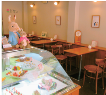
明るく落ち着く店内