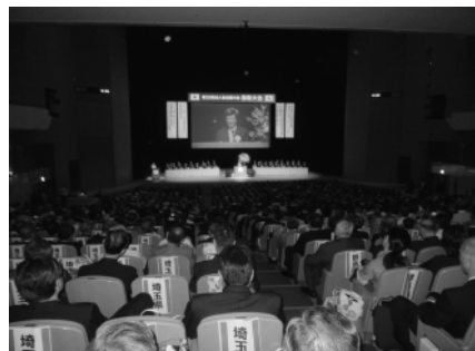
1700名の会員等で盛況

「本格的な事業承継税制の創設」等を中心とする「平成31年度税制改正に関する提言」の実現を強く求める。