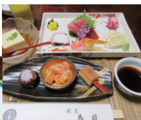
彩り鮮やかな前菜とお刺身

10名以上なら、前菜・刺身・小鉢・煮物・揚物などにお食事がつく5000円の2時間飲み放題コースもある。馬目さんは「落ち着いた空