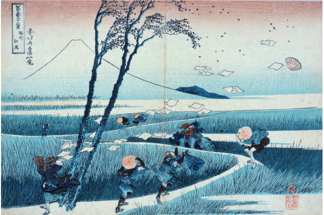
すみだ 北斎美術館蔵