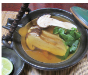
松茸1本使った香り豊かな土瓶蒸し