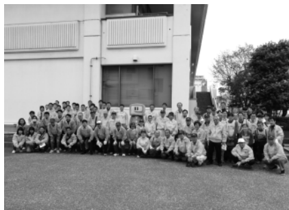
参加者みんなで集合写真

10月13日(土)大島地区において、第40回目となる社会貢献活動「まちをきれいに」が行われた。