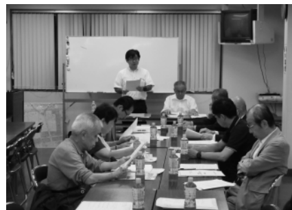
大島第4・第5支部合同研修会