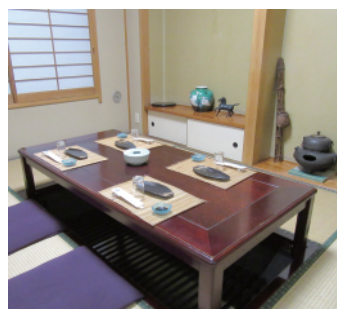
落ち着いた掘りゴタツの和室