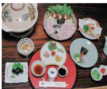
ふぐの美味さを楽しめる「ふぐコース」

間で季節の料理を心ゆくまで堪能ください。ご接待・ご宴会・ご法要などもお任せください」とのこと。