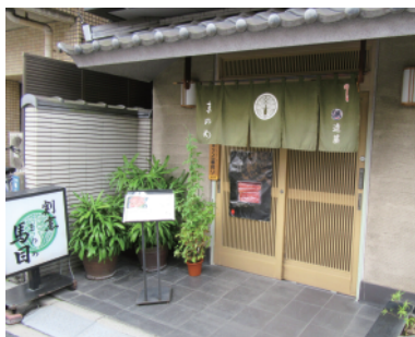
割烹「馬目」さん入口

お店は、JR亀戸駅東口から徒歩10分。城東消防署手前、昭和橋通りを入って200m先右側にある。昭和42年創業で四季折々の日本料理を楽しめるお店だ。割烹と聞くと少々敷居が高く感じてしまう