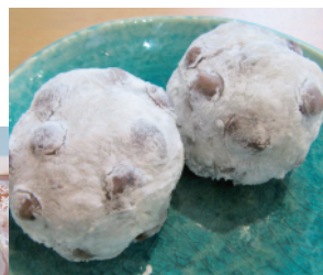
豆大福 (つぶあん) 1個130円

特に人気の商品を伺うと、柔らかいお餅と赤えんどう豆がたっぷり入った、甘過ぎず塩気も絶妙な「豆大福」や、ふつくらと焼き上げた香ばしい生地にさつぱりとした甘さのつぶ餡を挟んだ「どら焼」、なめらかなこし餡を生地で包み植物油でさつくり揚げた