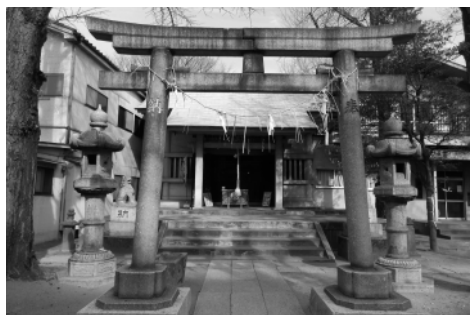
▲有形文化財多い志演尊空神社

古文書「東都歳時記」(天保8年刊)の5月22日の項に、日本三護摩として深川砂村志演稲荷祭、柴燈護摩修行ありとするされている。