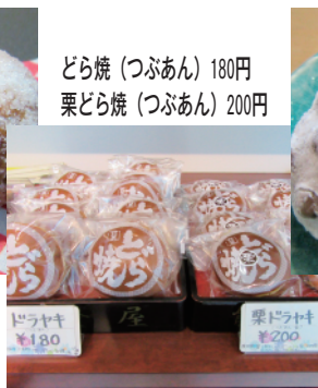
どら焼 (つぶあん) 180円 栗どら焼 (つぶあん) 200円