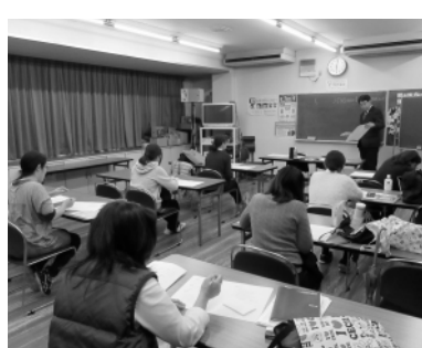
真剣な受講生と講師

平成24年から始まり、今回で7回目を迎えた江東東法人会主催の「簿記3級検定」講座が平成30年11月15日から平