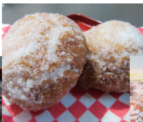
あんドーナツ (こしあん) 1個140円