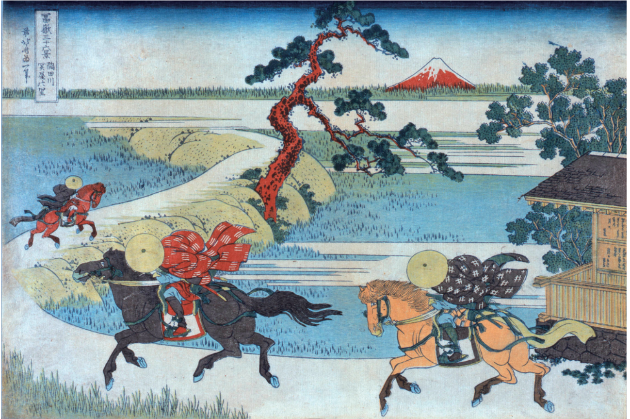
すみだ北斎美術館蔵