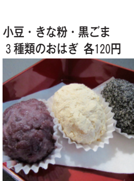
小豆・きな粉・黒ごま 3種類のおはぎ 各120円

「あんドーナツ」の他、千葉県産もち米を使い、小豆、きな粉、黒ごまの3種類から選べる「おはぎ」、高野豆腐や干しシイタケなど具だくさんの