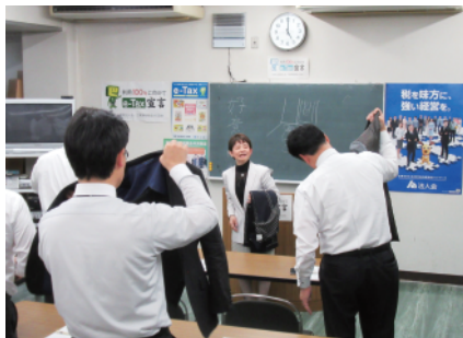
訪問先でのコートのたたみかた