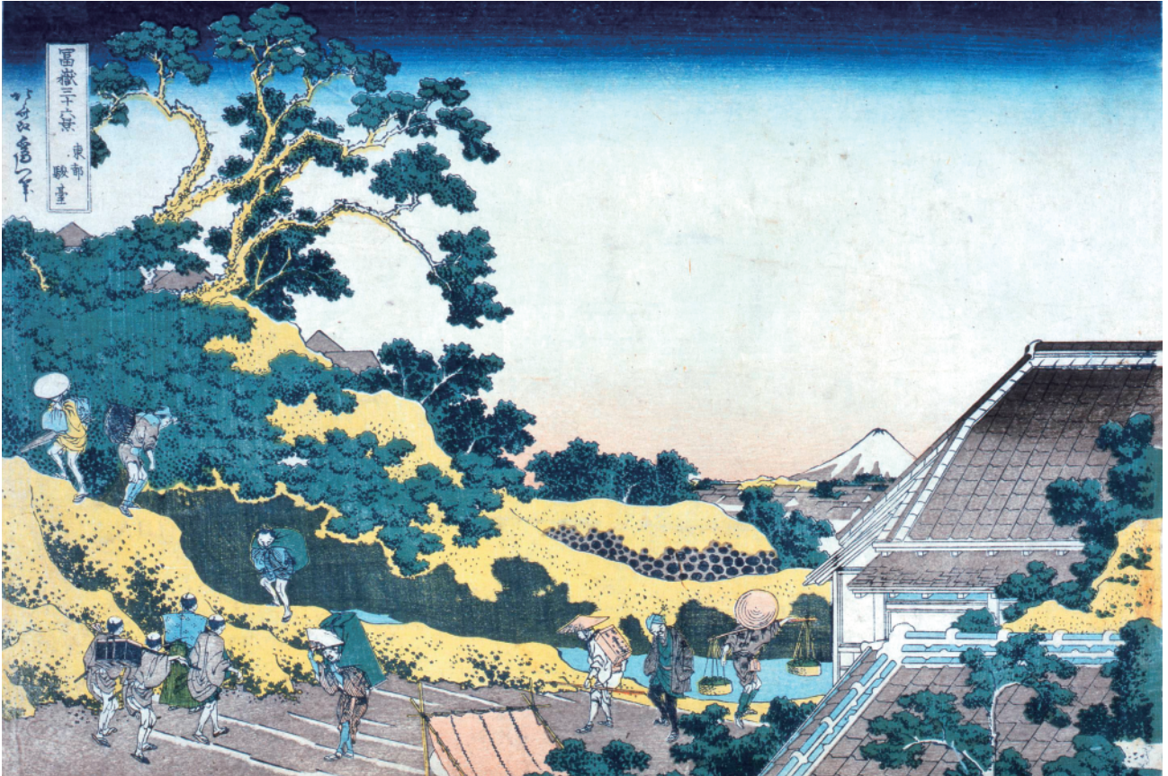
す み だ 北 齋 美 術 館 蔵