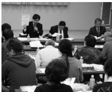
東砂第2支部研修会