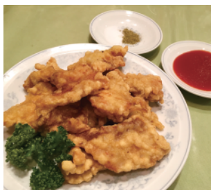
お酒にもご飯にも合う「豚肉の天ぷら」1,100円