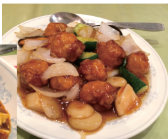
プリツとしたお肉「すぶた」1,200円