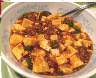
癖になる辛さ「マーボ豆腐」1,000円