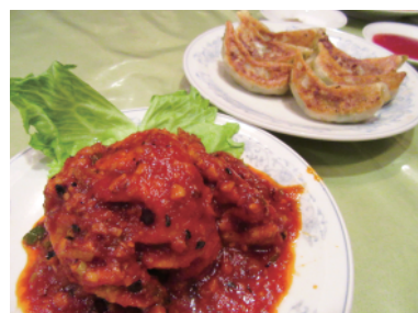
手前が新メニュー「爆々餃子」400円