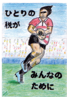
優秀賞 杉並区・小学6年生の作品 (狹窪法人会)