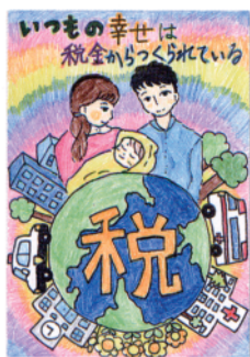
優秀賞 台東区・小学6年生の作品 (浅草法人会)