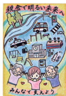
優秀賞 墨田区・小学6年生の作品 (向島法人会)