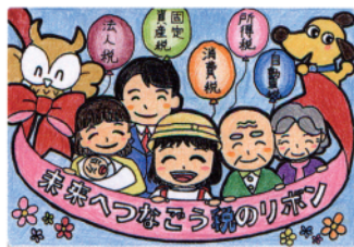
優秀賞 豊島区・小学5年生の作品 (豊島法人会)