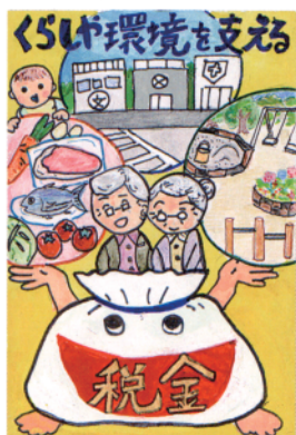
東京国税局長賞・全法連女連協会会長賞 品川区・小学6年生の作品 (荏原法人会)