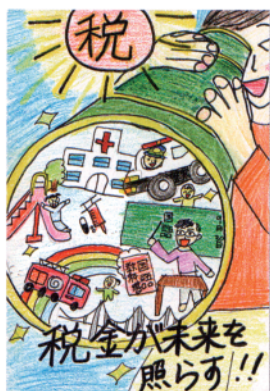
東京都知事賞・東法連女連協会会長賞 八王子市・小学6年生の作品 (八王子法人会)