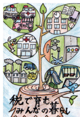
東京都主税局長賞・優秀賞 多摩市・小学6年生の作品 (日野法人会)