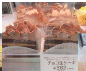
チョコクリームにチョコチップ入り「チョコ生ケーキ」