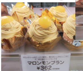
マロンモンブラン ¥362

ペ」は、「カスタード」や「チョコ」、「あまおう苺ミルク」の3種類の味があり、その他「ペコサブレ」や、切り口がペコちゃんの顔の「千歳飴」は子供から大人気だ！