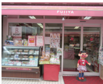
店頭でお出迎え中のペコちゃん

お店の創業は昭和25年頃。当時は駄菓子などの販売をしていたが、後に「不二家」さんとなった。