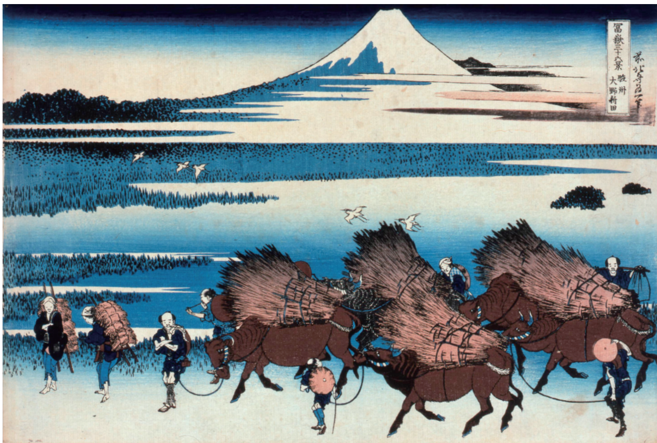
すみだ北斎美術館蔵