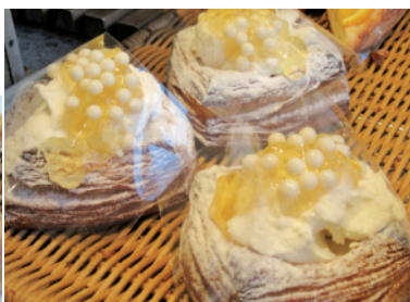
はちみつとクリームチーズ 367円 トッピングのホワイトチョコパールがカワイイ

ミとオリーブ」や薄く伸ばしたバケット生地にイベリコ豚のベーコンを巻いた「イベリコ豚巻き」はイベリコ豚の旨みがいじゅわ〜と生地に染み込み旨い。どれもワインやビールと共に頂きたくなる味だ。