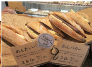
人気No.1発酵バターをサンド あんバターとめんたいバター 各313円

甘系では、デニッシュ生地 にクリームチーズと蜂蜜のジ ュレがトッピングされた「は ちみつとクリームチーズ」や、 チョコ生地のドーナツにた っぷりのチョコレートコー