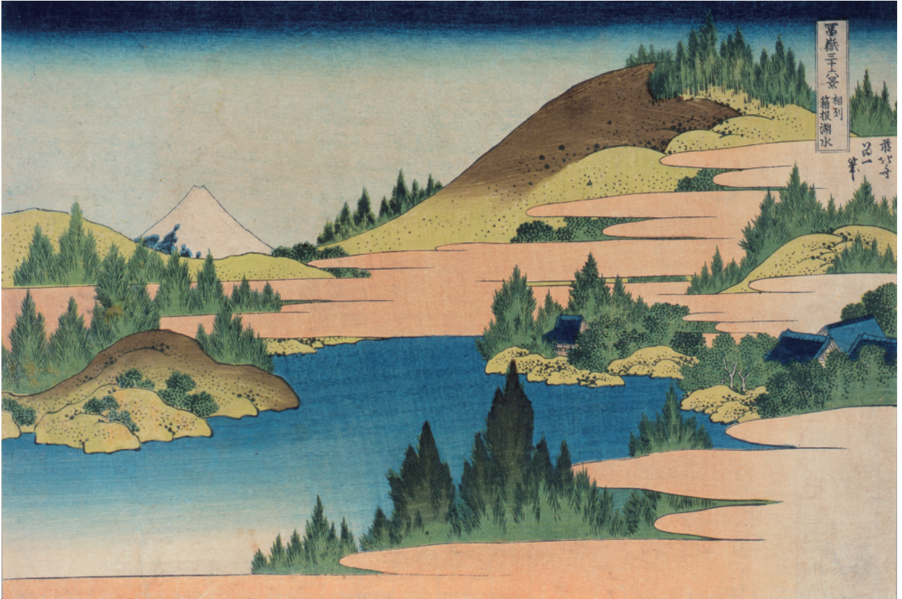
す み だ 北 斎 美 術 館 蔵