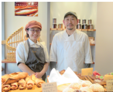
栄一社長と元パティシエの奥様

お店は改装しただけでなく、栄一さんが長年の修行の成果を発揮し、元パティシエの奥様とタッグを組み、次々と創作パンを生み出し、更なる人気店となっている。もちろん会長夫妻の力作、ナカヤの看板商品「あんぱん」も健在だ。