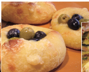
ワインと相性バツグン! オリーブのフォカッチャ 259円