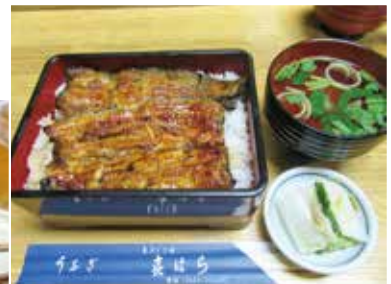
自慢の「鰻重」2,700円～ 写真は「松」4,100円(肝吸別)