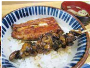
大人気ランチ (肝吸別) 「スタミナ丼」1,450円