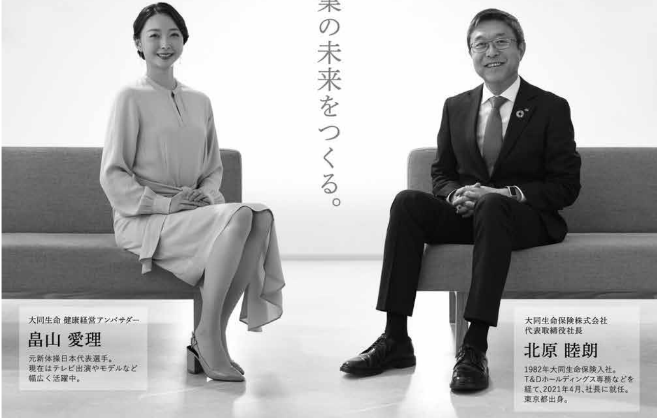
大同生命 健康経営アンバサダー