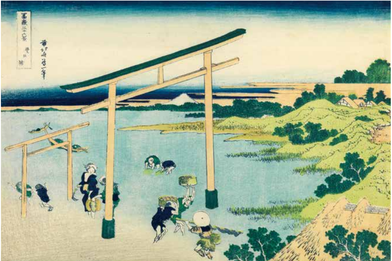
すみだ北斎美術館蔵