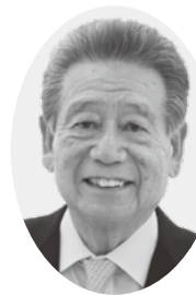
松本会長 (撮影のためマスクを外しています)

各種福利厚生制度の受託保険 会社の皆様方の暖かいご支援 ご協力を得て、事業活動を進 める。