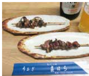
ビールのお共に!! 絶品「肝焼き」(1本)500円