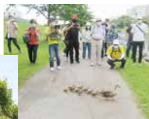
カルガモ親子と遭遇 行進の邪魔をしないよう そ〜っと撮影会となる。

賞状が授与され解散となった。健康寿命を延ばすため足腰の筋力強化となるウォーキング。今回は11月に開催予定。会員非会員を問わず多くの方のご参加をお待ちしています。