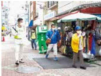
砂町銀座商店街にて 広報活動中のイータ君と 楠署長(左)、野地副会長(右)