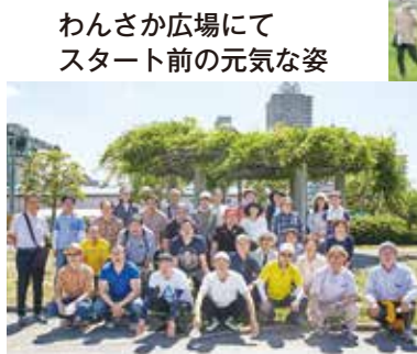
わんさか広場にて スタート前の元気な姿