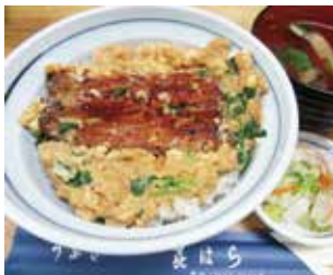
鰻のふわふわ玉子とじ 「うなぎ玉丼」1,350円(肝吸別)