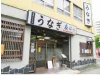
老舗の風格を感じさせる「菟はら」さんの入口

お店の創業は、なんと大正10年。西暦1921年ということ、満100年を過ぎた老舗の鰻屋さんだ。