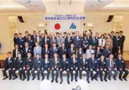
参加者全員で集合写真

江東東法人会の中核を担う頼もしい仲間が集う青年部会。今後の益々の発展を願うと共に一緒に活動してくれる新規青年部会員を随時募集中!