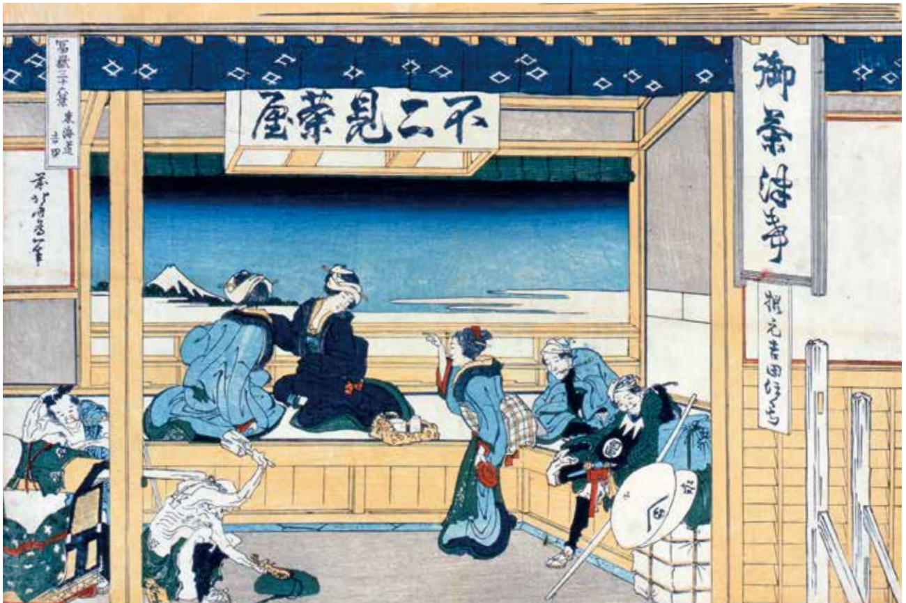
す み だ 北 齋 美 術 館 蔵