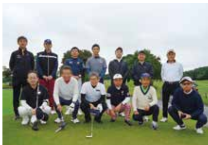
スタート前 ヤル気満々の参加者13名

10月18日(火) 江東東法人会主催で「会員の交流・福利厚生に資するための事業」として「スポーツを通じた会員交流会」を目的とした、第1回「親睦ゴルフコンペ」を開催いたしました。