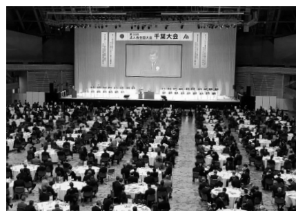
1,900名の会員等で盛況

また、当会では、この提言の実現のため、今後、地方自治体の首長などに対して陳情活動を行うこととしている。