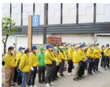
セレモニー挨拶に聞き入る参加者

10月22日(土)亀戸地区において、第45回目となる社会貢献活動「まちをきれいに」が行われた。