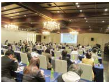
熱心に受講する参加者

最後に、ご出身地の福岡・北九州の見どころ・食べどころについて写真を交えて説明された。