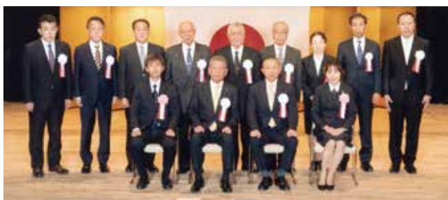
松本会長と会長表彰状受賞者