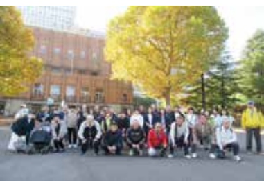
日比谷公会堂をバックに集合写真

また青年部会の柱である租税教育活動と部会員強化並びに財政健全化のための健康経営プロジェクトについて、一年間の取り組みと成果を発表し合い、情報交換を通じて全国の青年部会との連携が強化された大会となった。