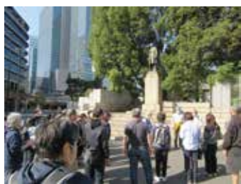
渋沢栄一像の前に到着 参加者全員揃ってゴール!!

日本橋を渡り、今回のゴールとなる日本経済の礎を築き、「近代日本資本主義の父」と呼ばれた渋沢栄一像の前に到着し、齊藤副会長より皆さんへ完歩賞が授与された。