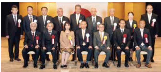
濱田署長と税務署長表彰状受賞者