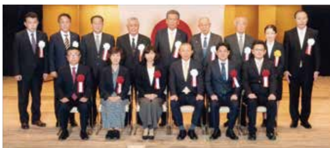
濱田署長と税務署長感謝状受賞者