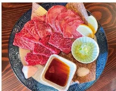
石垣牛でえじ上等ロース 1枚520円 でえじ上等タン塩 1枚320円

中でも沖縄から直送で届く「石垣牛でえじ上等ロース」の炙り焼は希少牛のため、お一人様3枚までと制限があるが是非お試しいただきたい一品。その他「石垣牛のタタキ」「もずくの天ぷら」「肉味噌ピーマン」も人気。またメの「沖縄そば」や「サーターアンダギー」「ブルーシールアイス」があるのも嬉しい。