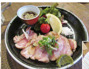
これ目当てに来る方も! ポン酢、レモン、塩、ワサビお好みでどうぞ。 地鶏のタタキ 680円