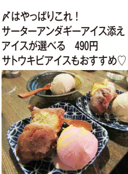
めはやっぱりこれ! サーターアンダギーアイス添えアイスが選べる 490円 サトウキビアイスもおすすめ♡

め。また平日限定の17時〜20時まで、生ビール、レモンサワー、ハイボールなどが何杯でも199円でいただけるサードビスは大変ありがたい。更