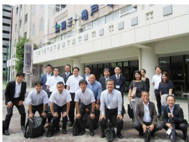
参加者全員で集合写真

校長室での反省会では、A組は静かなクラスで、質問はなかった。B組は活発ではなかったが、後半は手が挙がっていた。プロジェクトでは、先生の銅像を作りたいとの意見が出た。C組は、税金についてわかる人の挙手は1人。わからない人の挙手も1人であとの人は?であったが、班ごとの意見は出ていた。D組は静かなクラスで、班での意見は出るがまとまらなかった等の感想が出た。今回も、多忙にもかかわらず、税の意義や役割、日本の財政の現状等について説明をいただいた税理士先生、学校関係者の皆様のご協力を頂き、心から感謝申し上げます。