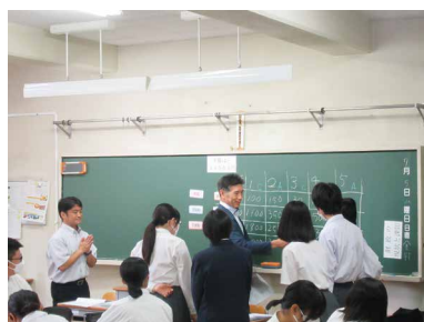
和気あいのD組の講師 左から水谷書記会計、丸山幹事と生徒

クラスを一つの国として、あるプロジェクトに3000万円の税金が必要で、その集め方を生徒に考えてもらうゲームだ。今回は収益金額がA500万円、B2500万円、C7000万円の3つの班に分かれ議論した。Cは収入が