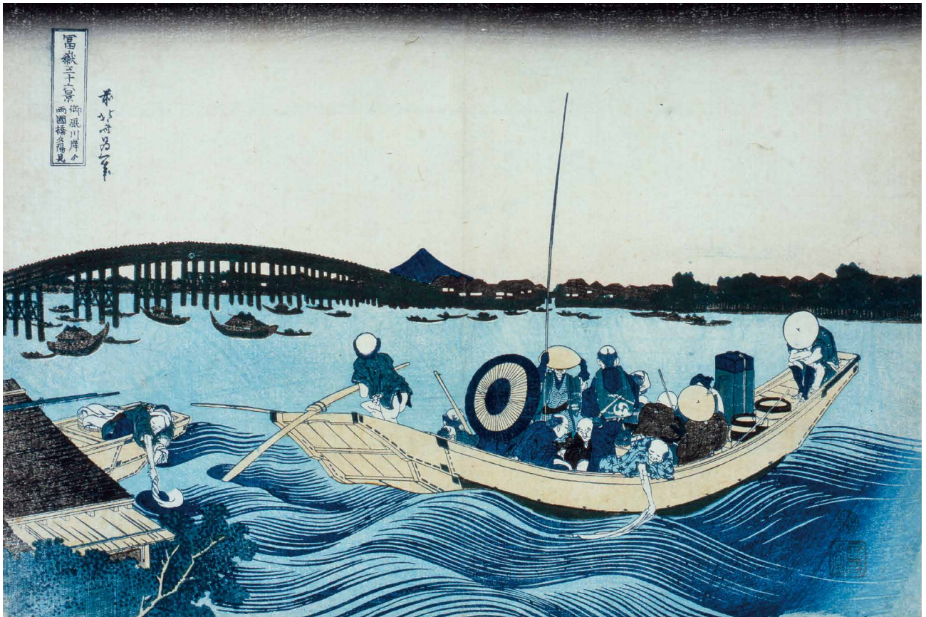
すみだ北斎美術館蔵