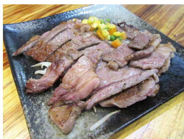
高安支部長さん おすすめ!! 黒毛和牛リブロース 200g 3,980円

スパ最強!!と大人気となっている。その他「牛タタキのサラダ」「牛スジ豆腐」「海鮮焼き」の他、じっくりと煮込んだ「ビーフシチュー」も人気。オリジナルステーキソースも3種類ありどれもオススメ。