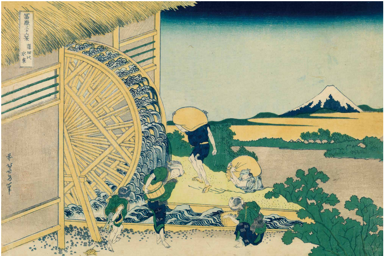
すみだ北齋美術館蔵