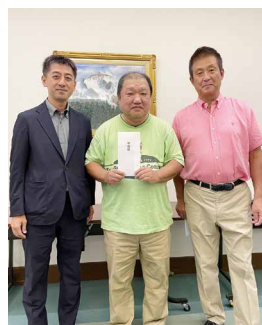
2位の渋谷さんと司会者

次の第4回ゴルフコンペ開催の際には、当会行事予定及びHP等でお知らせします。ゴルフの上手い下手関係なく、ご参加ください。