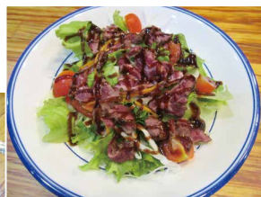
フレッシュ野菜とたっぷりのお肉が嬉しい スモークフレーバーソースの牛タタキのサラダ 680円