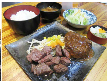
大人気 おすすめ! ランチAセット ステーキ&ハンバーグ 1,450円

タンなど好みに応じて1000gから選べ、絶品デミグラスソースとの相性抜群の「ハンバーグ」はジューシーで味わい深い。ハーブソルトで味付けた「チキンステーキ」も人気。全て鉄板でカットしてくれるのでお箸でいただけるのも嬉しい。