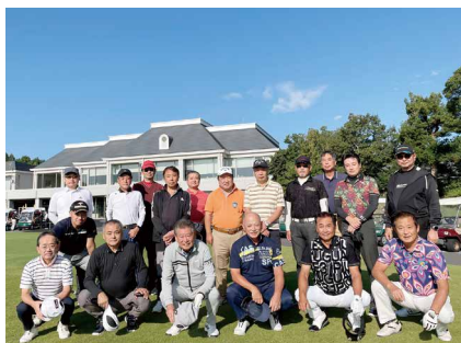
青空の下で集合写真

10月12日(木) 江東東法人会主催で、第3回「法人会親睦ゴルフコンペ」が開催された。