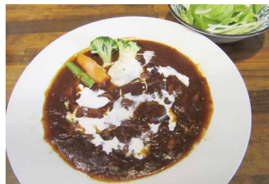
圧力鍋でじっくり煮込んだトロトロのお肉がたっぷりの絶品! ビーフシチュー 980円

スパ最強!!と大人気となっている。その他「牛タタキのサラダ」「牛スジ豆腐」「海鮮焼き」の他、じっくりと煮込んだ「ビーフシチュー」も人気。オリジナルステーキソースも3種類ありどれもオススメ。