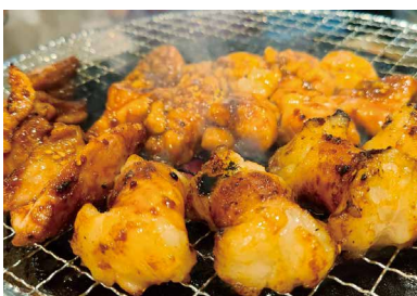
じゅっつ! と焼かれるぶりっぶり っのホルモン(上) 小腸680円、 (下) 丸小腸680円

「ナムル」もおすすめの他、お 得なガッツリ食べて飲み放題 が付くコースもあり、家族連 れや女子会にも人気だ。