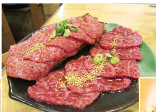
※要予約 あったらラッキー! 超絶品♡ 厚切タン塩1980円