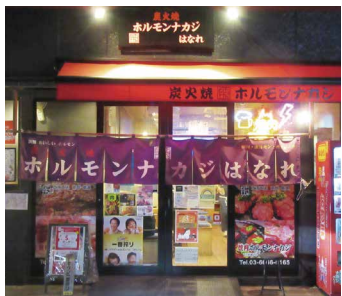
はなれ入口 店内に入ると、 サービス魂のスタッフがお出迎え

お店は、メトロ東西線『南 砂町』駅2a出口から徒歩8分 の元八幡通り沿いにあり、平 成26年に「ホルモンナカジ本 店」、その2年後に今回取材の 「ホルモンナカジはなれ」を本 店の4軒隣にオープン。