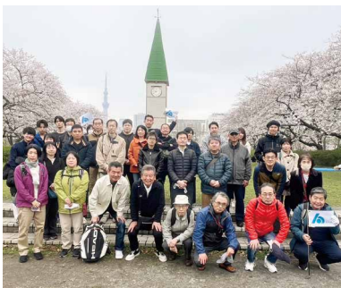
猿江恩賜公園の時計塔前にて