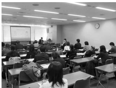
定額減税のDVDを視聴

説明会では、講師の江東東税務署法人課税第1部門高田上席が「定額減税の概要」「給与支払者の事務のあらまし」「月次減税事務の手順」「年調減税事務の手順」「源泉徴収票への表示」などを説明された。定額減税説明会の申込は、事前申込が必要で、国税庁LINE公式アカウントから申込みか、参加を希望する説明会会場の担当税務署の源泉所得税担当にお電話ください。