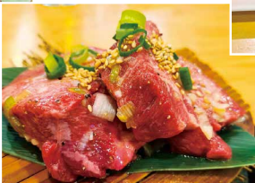
何枚でもイケる! 上質ラム肉 赤身(左)イチボ1600円 赤身(右)ラム1600円