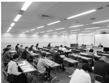
多くの方にご参加をいただいた

務者が早期に準備に着手できるように4月と5月の計10回の説明会を行うこと。また、国税庁HPでも「定額減税 特設サイト」にて情報を入手・閲覧できると説明された。