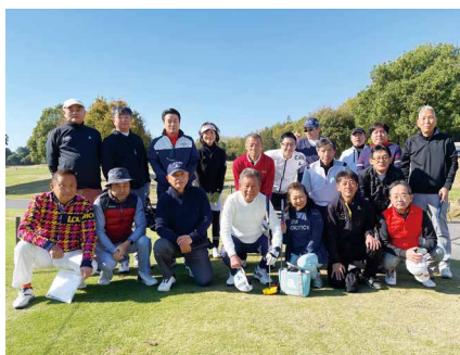
スタート前の集合写真

4月10日(水) 江東東法人会主催で、第4回「法人会親睦ゴルフコンペ」が開催された。