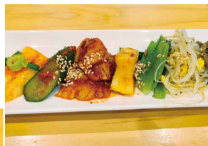
合盛1人前(写真) とりあえずは、これ! ナムル盛680円 キムチ盛680円