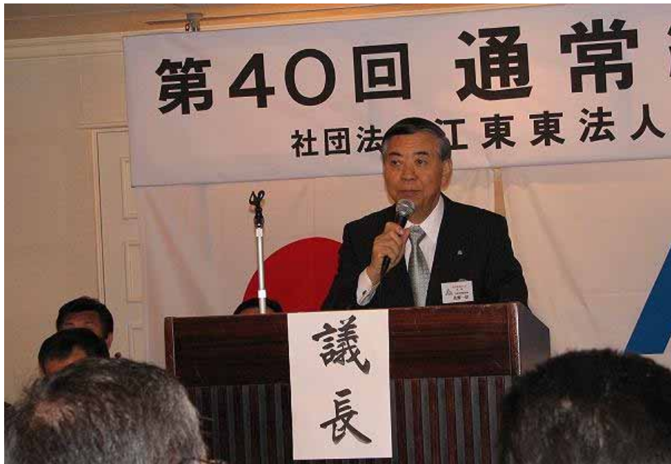
佐野会長により議事進行