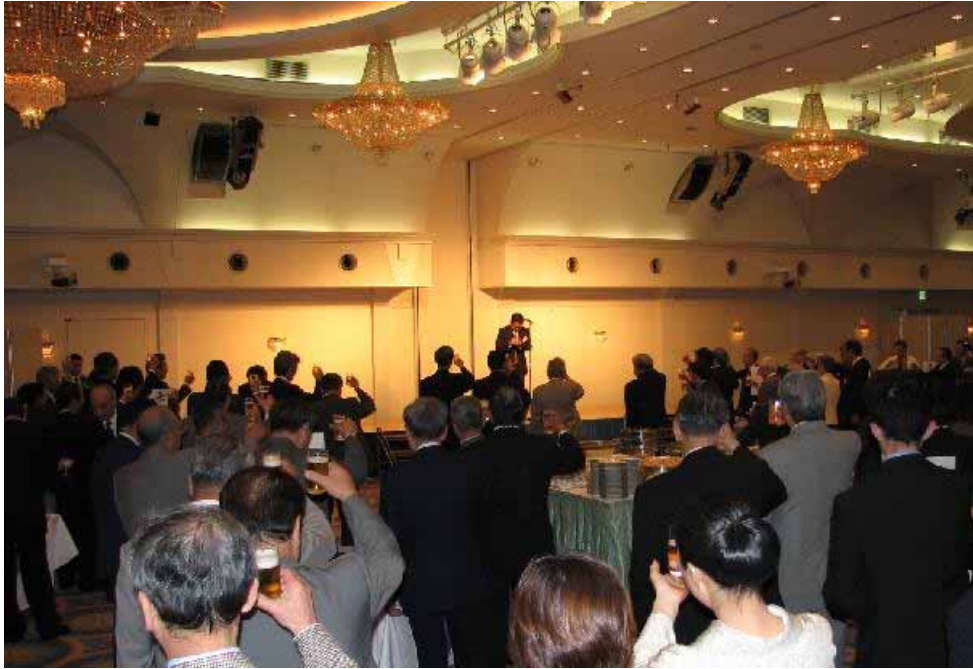
210名の参加者で盛況の会場