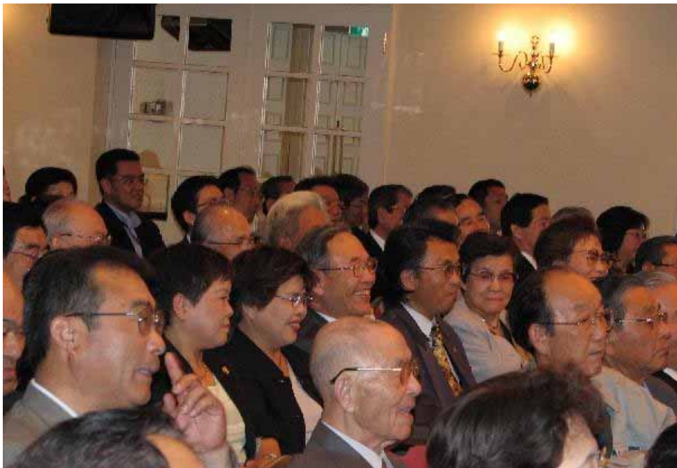
ユーモア溢れる講演に笑いの渦