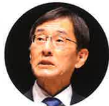
あいさつをする 住澤整国税庁長官

第39回法人会全国大会・群馬大会が、10月18日、高崎市の高崎芸術劇場で開催された。当日は全国から約1500名、うち東京から約190名の会員が参加した。